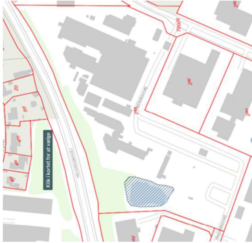
Figur 1 - §3 søens beliggenhed